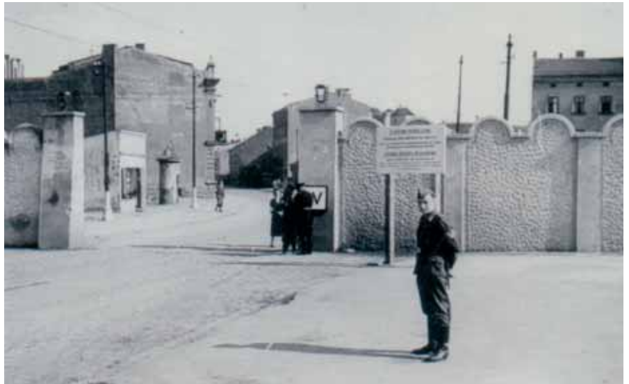
Brama getta przy placu Zgody

Stań tyłem do mostu na Wiśle i spójrz przed siebie. Porównaj to, co widzisz, ze zdjęciem. Spróbuj odnaleźć miejsce, w którym znajdowała się brama prowadząca do getta i zaznacz ją na mapie.