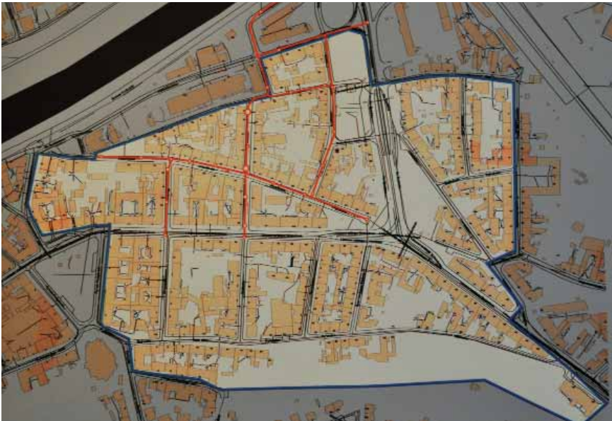
Schemat przebiegu kanałów na terenie getta w Krakowie, ze zbiorów MHK

Uciekali starzy i młodzi, kobiety i dzieci i gdyby nie zdrada, droga ta wielu osobom mogła być uratować życie. [...] Niedługo to jednak trwało. W ślad za uciekającymi pognąła zdrada. Meldunki o ucieczce Żydów wędrowały po drutach telefonicznych do posterunków policyjnych i w krótkim czasie otwór wyjściowy kanału był już obstawiony przez policję, a następni uciekinierzy wpadali w ręce Niemców. W wielu wypadkach, strzelano do wynurzających się z otworu ludzi, zabijając ich na miejscu.