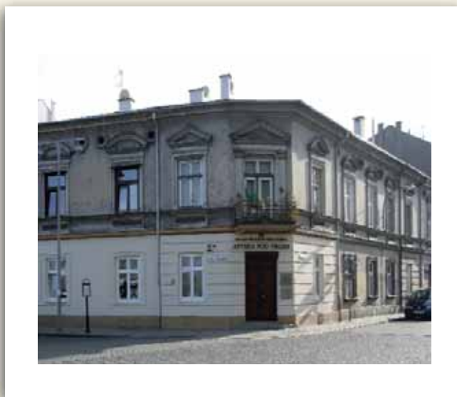
Budynek, w którym mieściła się apteka „Pod Orłem”, dziś siedziba oddziału MHK

„Apteka pod Orłem” – to początek Twojej wędrówki po fragmencie byłego getta krakowskiego. Poznasz instytucje zlokalizowane w pobliżu apteki, które w znacznym stopniu organizowały życie zgromadzonej tu ludności żydowskiej. W samej aptece mieszkańcy getta spotykali się i szukali pomocy; z jej okien Tadeusz Pankiewicz obserwował wydarzenia na placu Zgody. Oto co pisze o swojej aptece sam właściciel: