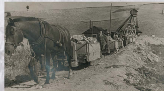
Wywożenie urobku z kopalni.

Jak głosi encyklopedia – minerału, Będącego drobnoziarnistą odmianą gipsu. Znany był już w starożytności, uznawany Za wyśmienity surowiec rzeźbiarski. Wykonywano z niego przedmioty dekoracyjne, A także użytkowe. Traktowano jak kamień Okładzinowy, wykorzystywano do produkcji Sypkiego gipsu. Dziś jednak, mimo iż jego Złoża są wciąż spore i uważany jest Za materiał bardzo dobrej jakości, Nikt go tu, z różnych przyczyn, już nie wydobywa.