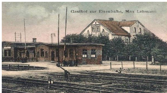
Gruß aus Schönwalde, -Kr. Sorau